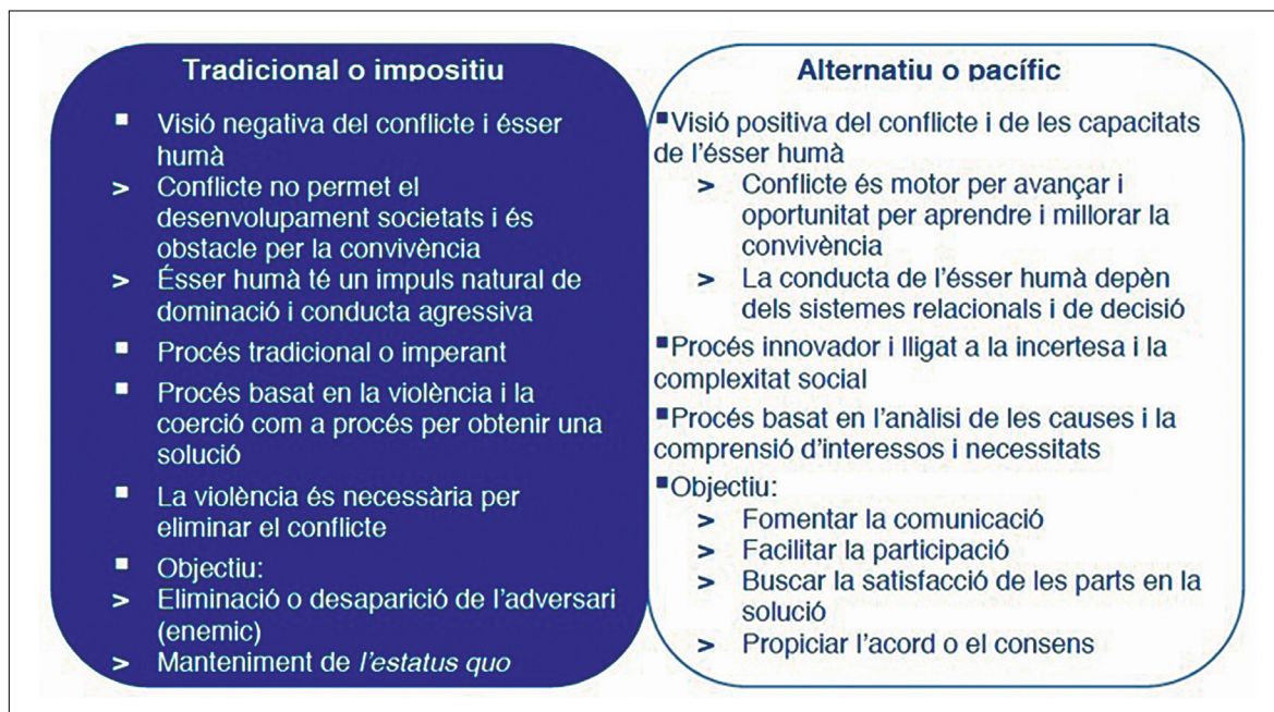
Gràfic 2. Comparació de models teòrics de gestió i resolució de conflictes

Tenint en compte que els conflictes en l'oci nocturn, com en la resta de conflictes d'altres àmbits, requereixen cada cop més acords entre les parts implicades i afectades, i la generació de consens sobre com abordar i gestionar aquestes problemàtiques a mitjà i llarg termini, es planteja la incorporació de la conflictologia, en concret de la mediació, com un sistema per a la gestió d'aquests conflictes.